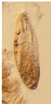
Figura 1. Oxytricha sp. Contraste Diferencial de Interferencia, 20x

Para la identificación de los protozoos básicamente se utilizan caracteres morfológicos por lo que es importante contar con una buena herramienta para su observación y, en este caso, la iluminación de Contraste Diferencial de Interferencia cumplió un papel fundamental.